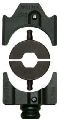
Yttre backhållare V1318, BNP backar, inre backhållare V1316.