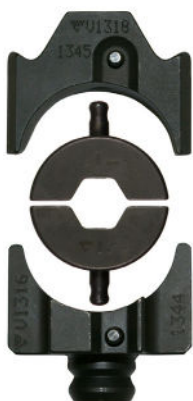
Ytre bakkeholder V1318, BNP-bakker, indre bakkeholder V1316.