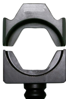
Integrerte bakker 13B38