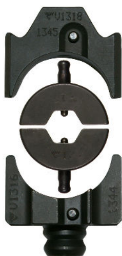
Bakkeholder V1318 og V1316 med B-bakker

CASE ADVANCED , El-nr 20 001 46 (kun koffert)